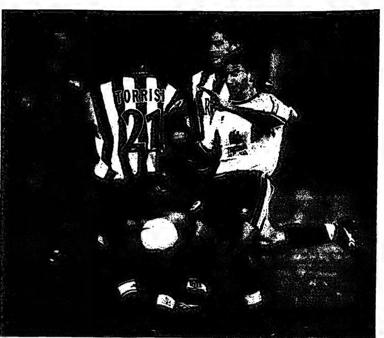
كرة قدم لاصب لاصب، يمشون على الجسر سلف لاصب في الصباح على الكرة (الاصب)